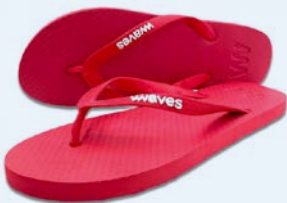
WAVES RED TAILLE 3 À 11