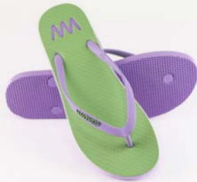
WAVES BENTOTA TAILLE 3 À 7