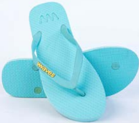
WAVES LIGHT BLUE TAILLE 5 À 8