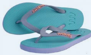
WAVES MIDIGAMA TAILLE 3 À 7