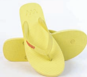
WAVES YELLOW TAILLE 3 À 11