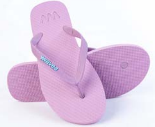
LIGHT PURPLE TAILLE 3 À 11