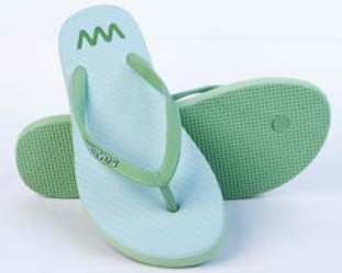
WAVES DALAWELLA TAILLE 3 À 7