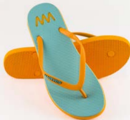
WAVES GINTOTA TAILLE 3 À 7