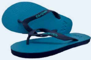
WAVES ARUGAM BAY TAILLE 5 À 11