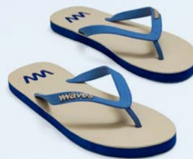
WAVES KAHAWA TAILLE 5 À 11