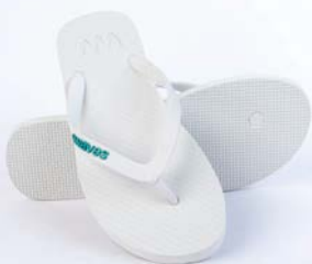
WAVES WHITE TAILLE 3 À 11