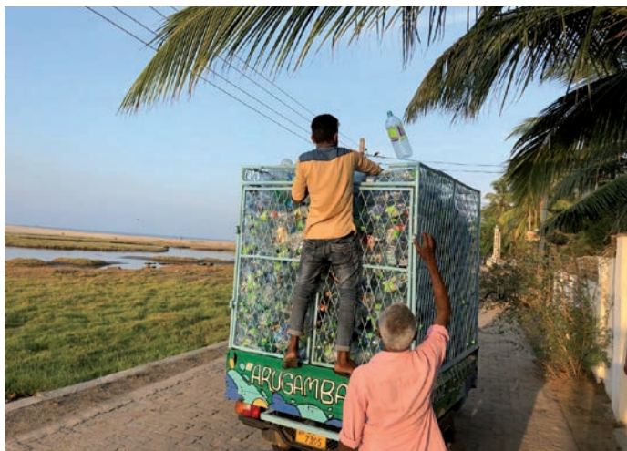
Ramassage de bouteilles en plastique : projet de recyclage au Sri Lanka