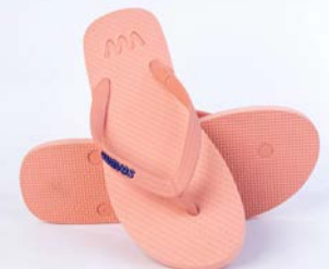
WAVES PINK TAILLE 3 À 11