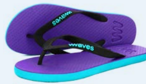
WAVES WHISKEY POINT TAILLE 3 À 7