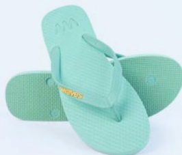
WAVES TOURQUOISE TAILLE 3 À 11