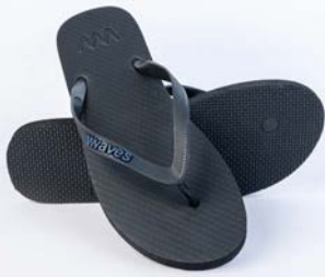
WAVES BLACK TAILLE 3 À 11