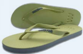
WAVES OKANDA TAILLE 3 À 7