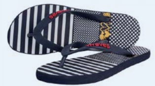
WAVES ANHANGAMA TAILLE 3 À 7