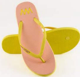
WAVES GANDARA TAILLE 3 À 7