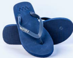
WAVES NAVY BLUE TAILLE 3 À 11