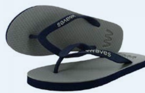
WAVES MIRISSA TAILLE 3 À 11