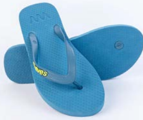
WAVES RIVERA BLUE TAILLE 3 À 11