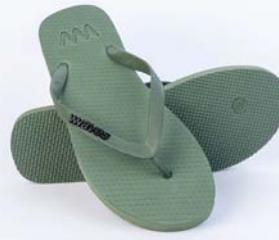
WAVES KHAKI TAILLE 3 À 11