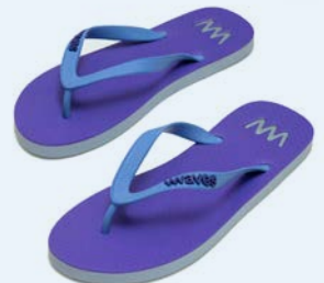
WAVES KOSKODA TAILLE 5 À 11