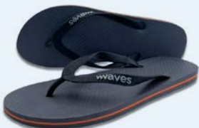
WAVES PEANUT FARM GRÖSSE 5 BIS 11