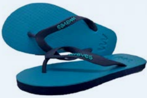
WAVES ARUGAM BAY GRÖSSE 5 BIS 11