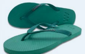
WAVES DEWATTA GRÖSSE 3 BIS 11