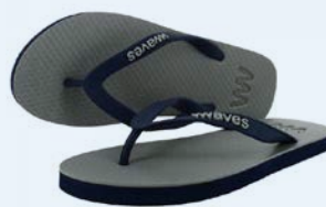
WAVES MIRISSA GRÖSSE 3 BIS 11