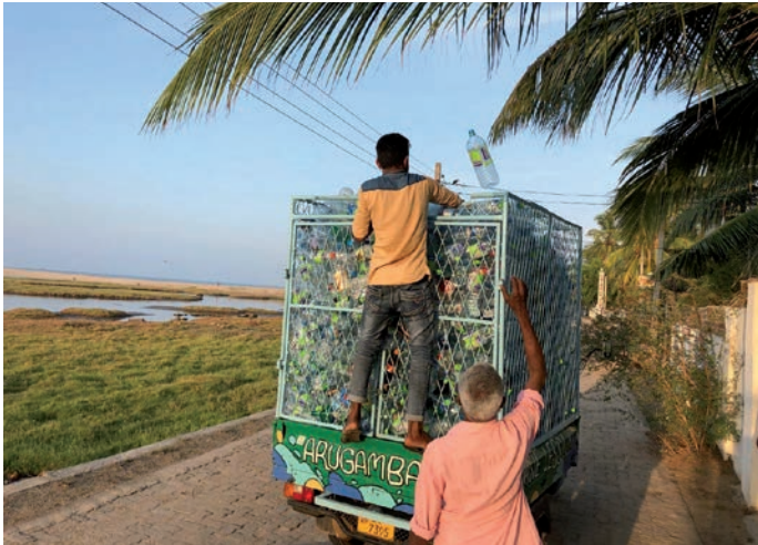
Einsammeln von Plastikflaschen: Upcycling-Projekt auf Sri Lanka