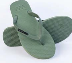
WAVES KHAKI GRÖSSE 3 BIS 11