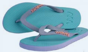
WAVES MIDIGAMA GRÖSSE 3 BIS 7