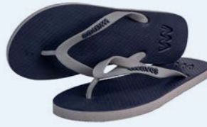
WAVES BOOSA GRÖSSE 5 BIS 11