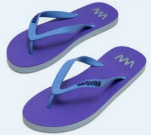
WAVES KOSKODA GRÖSSE 5 BIS 11