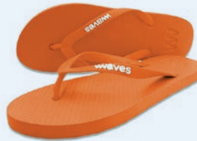
WAVES ORANGE GRÖSSE 3 BIS 11