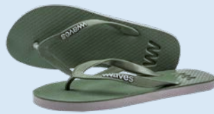
WAVES WELIGAMA GRÖSSE 5 BIS 11