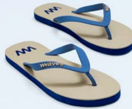
WAVES KAHAWA GRÖSSE 5 BIS 11