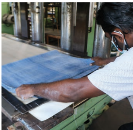
Fabrication de tapis de yoga