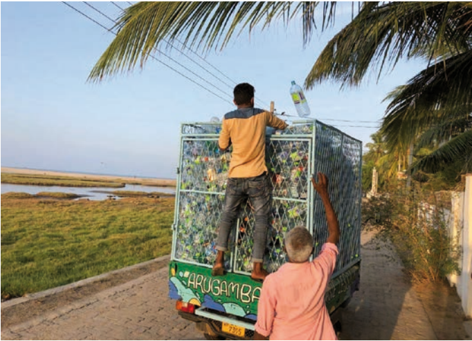
Ramassage de bouteilles en plastique : projet de recyclage au Sri Lanka