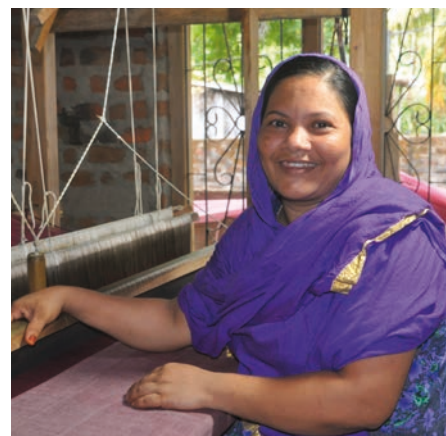
Tisseuse au Sri Lanka