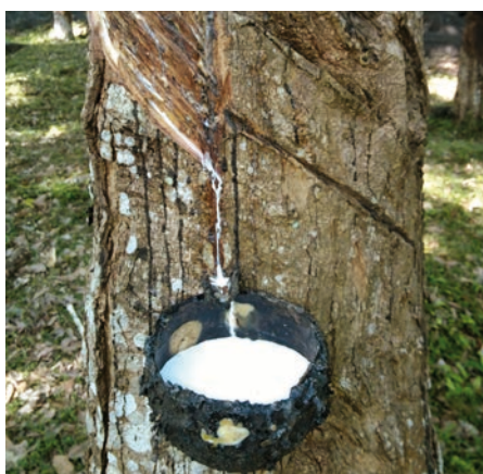
Récolte du latex

Et bien sûr, nous vous remercions de votre soutien pour intégrer FAIRMOVE dans votre assortiment.