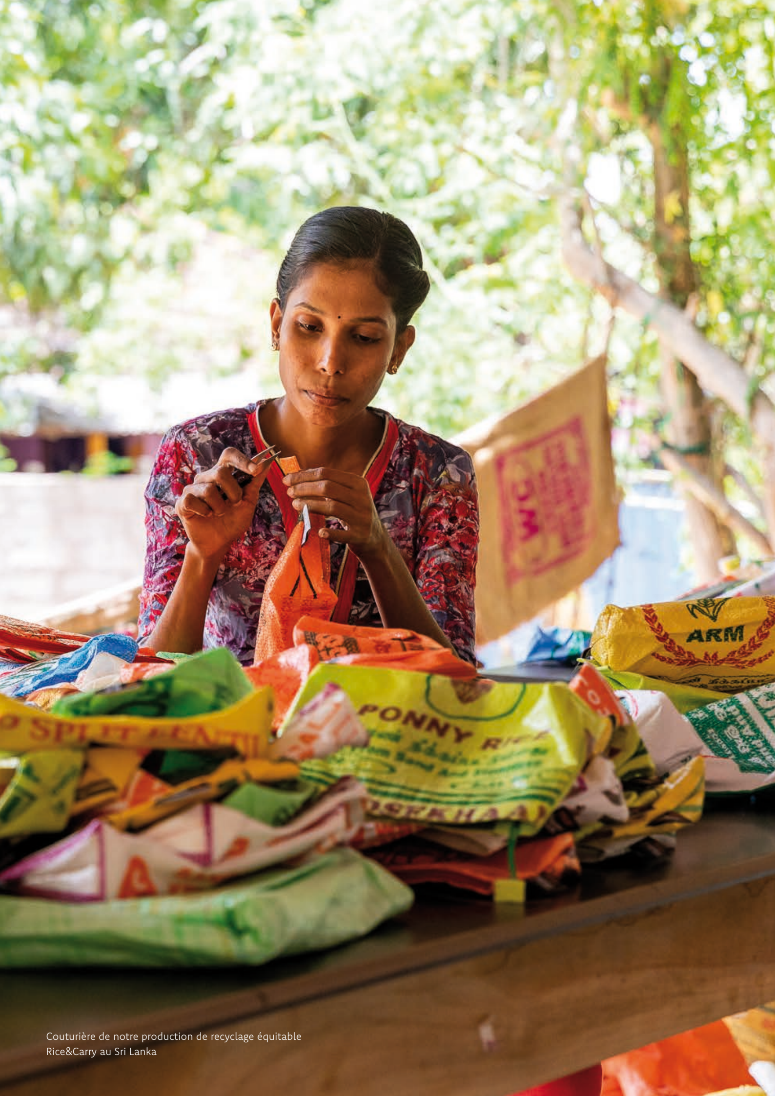
Couturière de notre production de recyclage équitable Rice&Carry au Sri Lanka