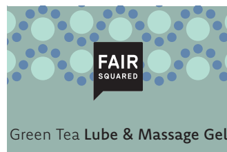
Green Tea Lube & Massage Gel