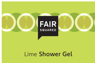
Lime Shower Gel