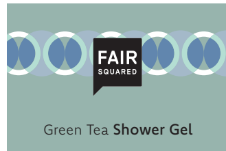
Green Tea Shower Gel

2500 ML COSMETAINER ART.-NR.: 4910474 EAN: 4260663810811