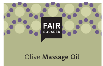
Olive Massage Oil

2500 ML COSMETAINER ART.-NR.: 4910494 EAN: 4260663810927