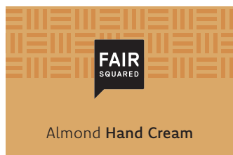
Almond Hand Cream

2500 ML COSMETAINER ART.-NR.: 4910487 EAN: 4260663810941