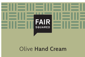
Olive Hand Cream